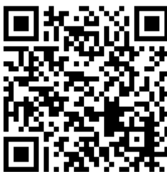
ภาพที่ ๒ QR CODE Youtube Channel ศูนย์เฉพาะกิจคุ้มครองและช่วยเหลือเด็กนักเรียน สพฐ.